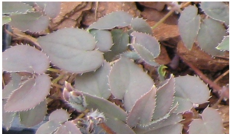
Epimedium grandiflorum – jeunes feuilles

Leur seul défaut, pensent certains, sera de perdre leurs feuilles en hiver. Mais ce défaut peut aussi être vu comme un avantage, vous ne serez plus obligé de supprimer les vieilles feuilles en fin d'hiver. Pour les espèces à feuillage persistant les fleurs sont souvent cachées par ce feuillage devenu 'fatigué' ou carrément moche.