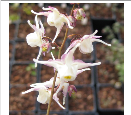
Epimedium grandiflorum 'White Queen'

Engrais : comme pour toute plante, un apport d'engrais (de préférence organique) chaque année est bénéfique. Si votre terre est pauvre, pensez à renouveler cet apport en été, c'est le moment où se forment les bourgeons pour la floraison de l'année suivante.