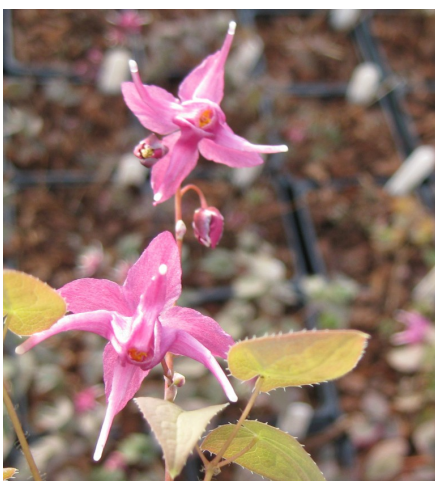
Epimedium grandiflorum 'Red Queen'

Le vrai avantage des epimedium grandiflorum (et tout est dit dans son nom) est la taille des fleurs. Grandes et élégantes elles se tiennent en haut des tiges comme autant de petits insectes survolant les jeunes feuilles. Elles ont l'air si délicates qu'on oublie qu'il s'agit d'une plante robuste et peu exigeante.